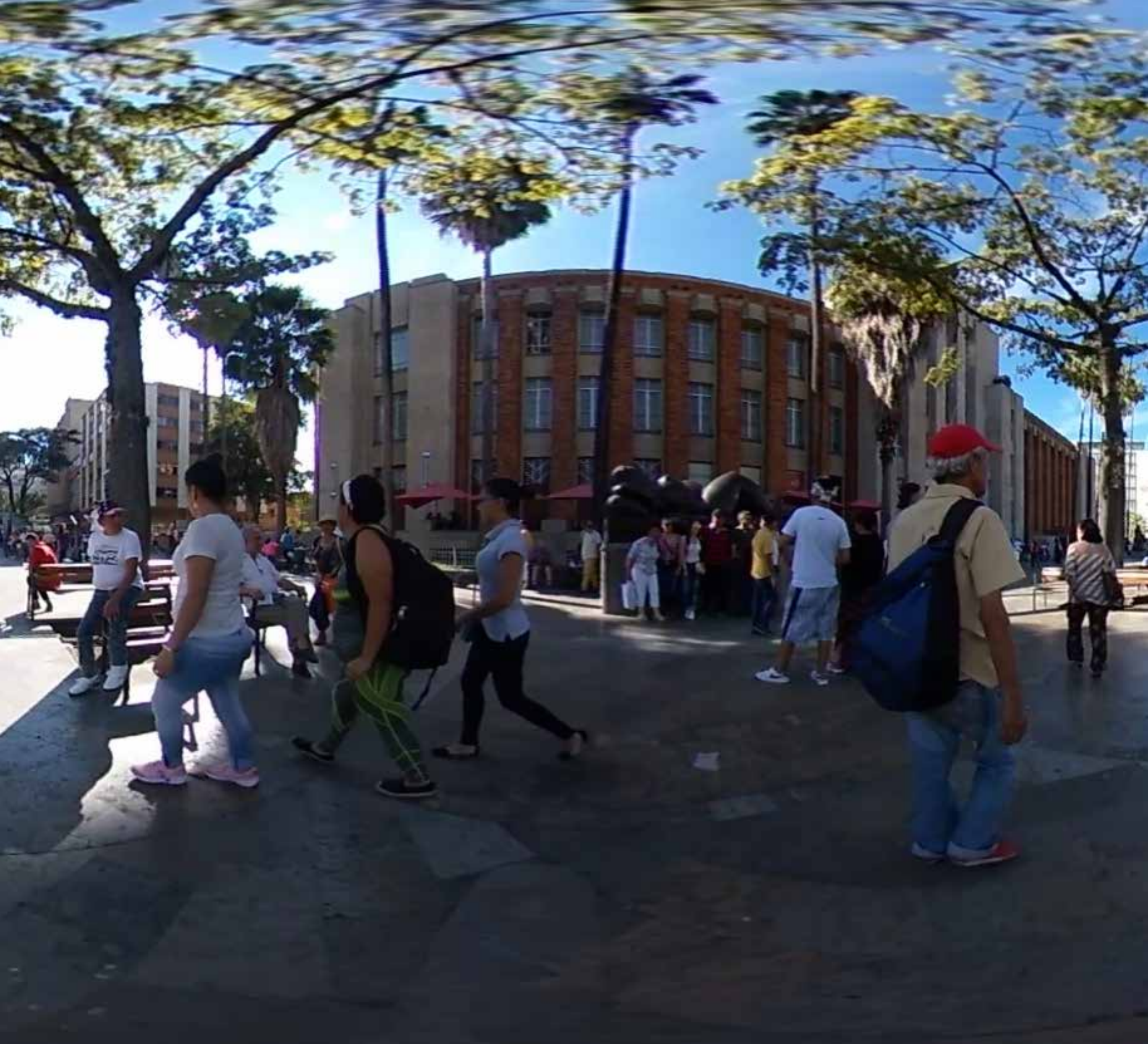
Medellin, CO - 2018